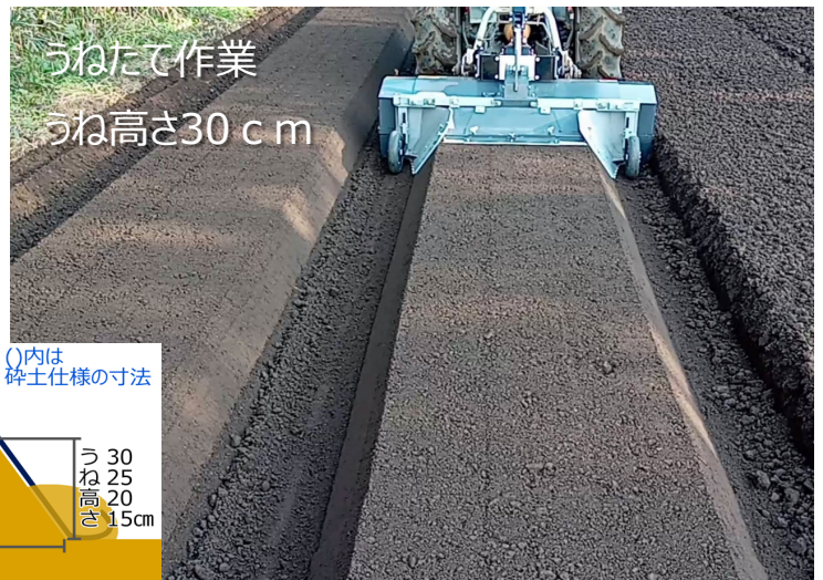
うねたて作業 うね高さ30cm