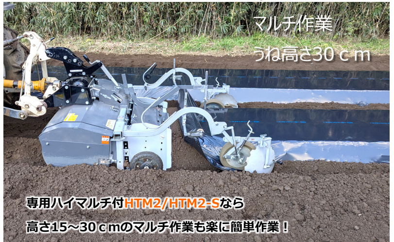
マルチ作業 うね高さ30cm

専用ハイマルチ付 HTM2/HTM2-S なら 高さ15~30cmのマルチ作業も楽に簡単作業！