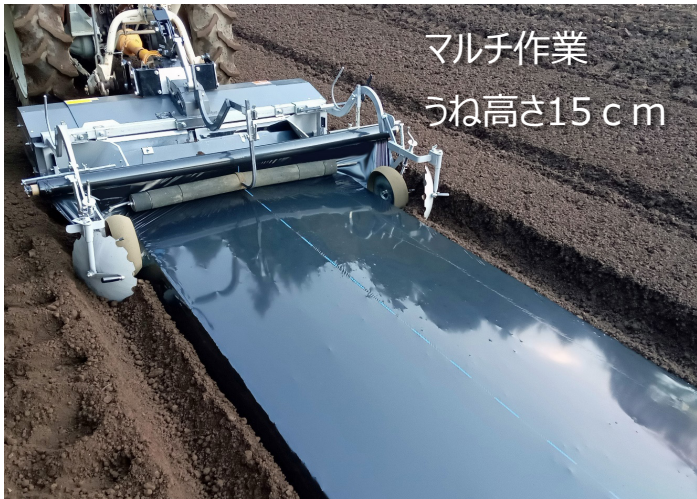
マルチ作業 うね高さ15cm