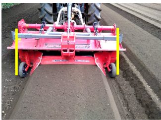
ロータリーと整形器の幅を合わせると一番きれいにできます。