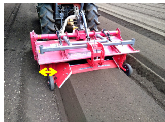
整形器溝幅 約13cm 引き出すと最大20cm