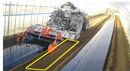
ロータリーよりも整形器の幅が短い場合は残耕ができて隣接畝も離れてしまいます。

整形器の全幅は、うね裾幅 + 26cmとなります。 ㊟溝幅延長板を引き出さない場合です。 マルチヤーの覆土ディスクまでの全幅の場合、うね裾幅 + 約50cmとなります。